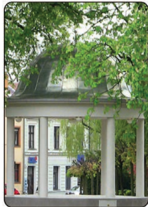
PROMENÁDNÍ KONCERTY V PARKU NA NÁMĚSTÍ

OTEVÍRACÍ DOBA INFOCENTRA na bělském zámku v době letních prázdnin pondělí – neděle 9:00 - 12:00 a 13:00 - 17:00