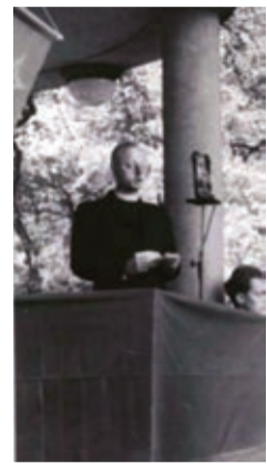
MUZEUM PODBEZDĚZÍ, pobočka Muzea Mladoboleslava