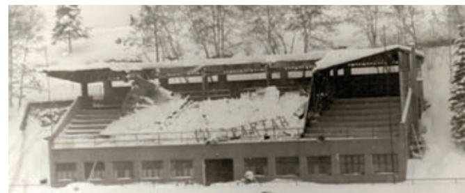
Pohled na část spadlé střešiny - únor 1970