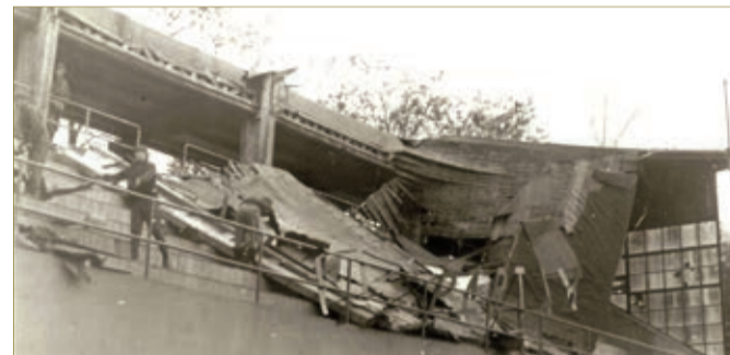
Odklizení spadlé střešiny - březen 1970