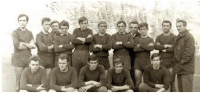
I. A mužstvo Sp. Bělá