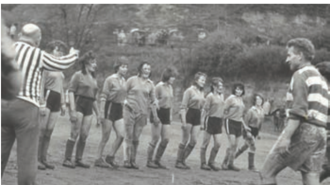
Dívčí jedenáctka JZD Markvartice ? (Verneřice?) Po skončení zápasu (delegovaný rozhodčí Hartman st.)