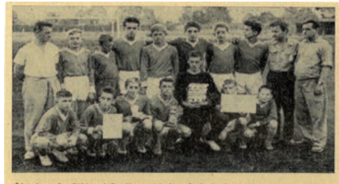
Žáci Spartaku Bělá pod Bezdězem získali v Přelouči Putovní pohár slušnosti časopisu KOPANÁ.