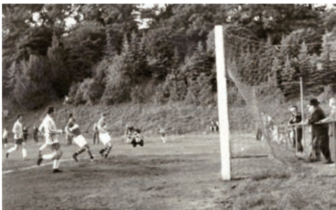
Ze zápasu s D. Poustevnou 1 - 0