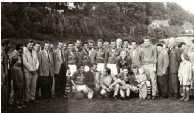
Vítěz Sp. Bělá v I. B třídě 1959 - 1960 a postup do I. A třídy