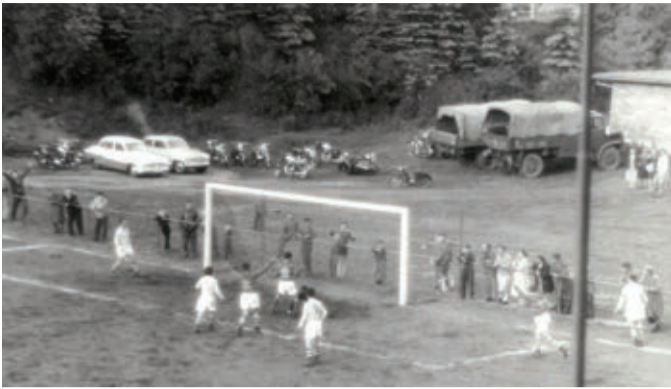
Ze zápasu s Cvikovem 3 - 1