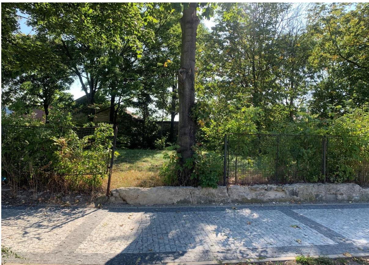
6- Podezdívka, plot a strom č.2 určený k výřezu.