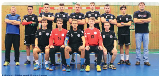
Sokol Bělá pod Bezdězem