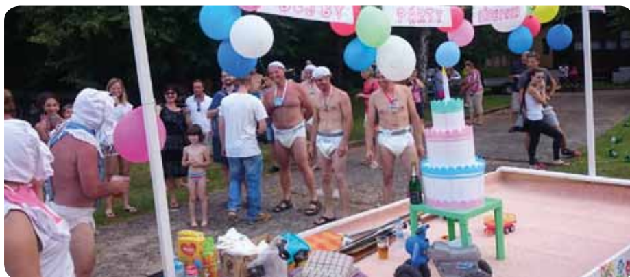
Vítězný tým Březinka