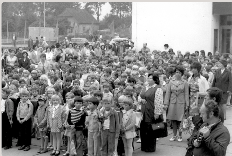
1976 - vítání prvňáčků poprvé u nové školy v Máchově ulici.