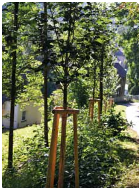
Nově vysazené jilmy habrolisté v Zámeckém příkopě. V. Blažková

Realizace proběhla v první polovině roku 2016 a celková cena jak revitalizace zeleně, tak pasportu činila cca 300 000,- Kč.