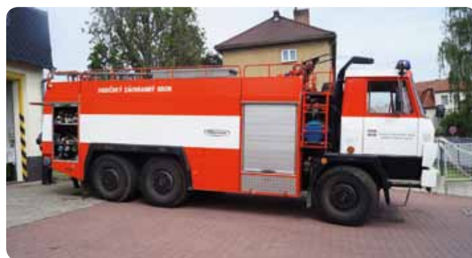
Nové vozidlo CAS 32T 815