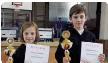
Naši úspěšní minižáci

Již 6. ročníkem Podbezděžského kordu byla o víkendu 19. - 20. 9. 2015 v Bělé pod Bezdězem otevřena nová sezona kordistů v kategorii ml. žáků, ml. žaček, žáků a žaček. Během obou dnů se turnaje zúčast-