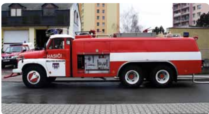
Staré vozidlo CAS T 32T 148