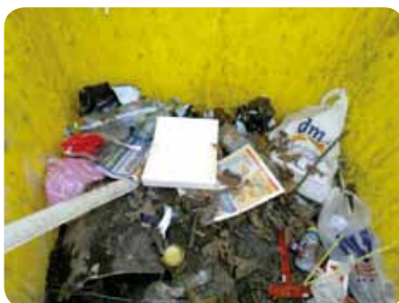
Komunální odpad do kontejneru na plasty nepatří!

Shromaždiště odpadů Města Bělá pod Bezdězem Sbíráme: papír, železo, sklo, tetrapak, textil, PET, pneumatiky, barvy, vyražené elektrozařízení, baterie, zářivky, nebezpečný odpad, bioodpad, objemný odpad, dřevo